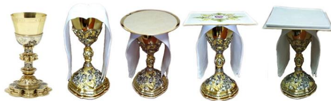
Použití kalichové pateny